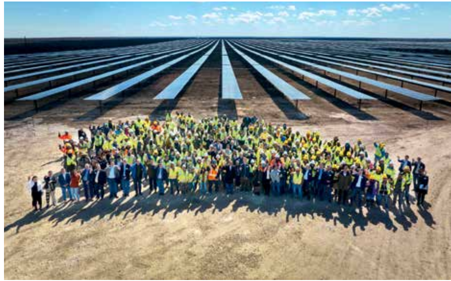
Progetto solare di successo: Galloway 2 in Texas USA.

Ecorobotix sviluppa, produce e commercializza tecnologie robotiche per l'agricoltura. Ogni anno, oltre 3,5 milioni di tonnellate di prodotti fitosanitari vengono utilizzati in agricoltura in tutto il mondo. A questi si aggiungono molti milioni di tonnellate di fertilizzanti. I prodotti fitosanitari proteggono le colture dai parassiti e dalle erbe infestanti. I fertilizzanti forniscono al terreno sostanze nutritive, migliorano e accelerano la crescita delle colture. Tuttavia, i pesticidi e in particolare i fertilizzanti chimici