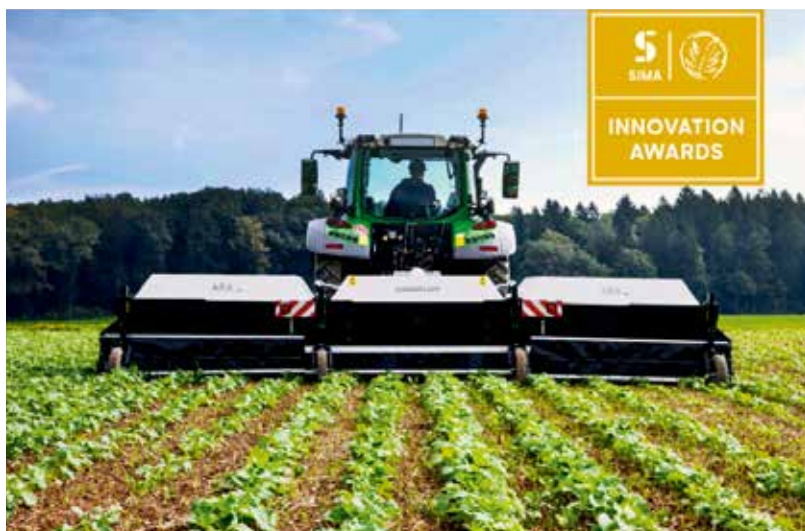
Ecorobotix ha ricevuto diversi premi per la sua tecnologia.

raccolti vengono elaborati e interpretati da un software, anch'esso sviluppato da Ecorobotix e basato su algoritmi di intelligenza artificiale. La funzione irroratrice vera e propria è svolta da specifici ugelli, controllati dal software del robot, che irrorano con alta precisione le piante o, a seconda dell'applicazione, gli spazi intermedi tra le piante.